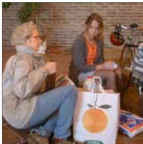
Fruntimmren på Resumé värmer och fritttrar med Val de Loire och dyngsgammal räkcocktail.