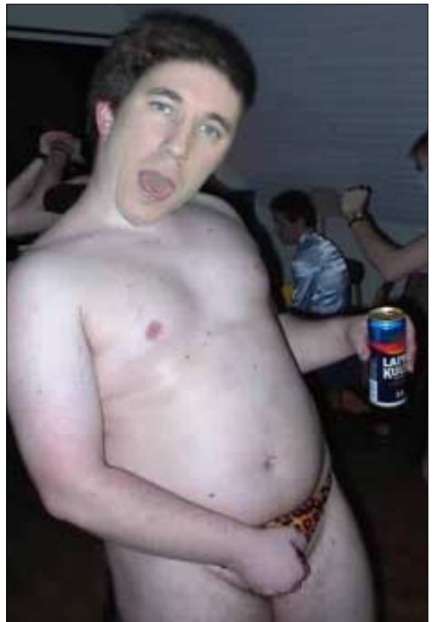
– Nehej pojkar, nu tror jag det får räcka, säger Kerj och blinkar. Det är ju en dag imorgon också!

– Nu skall jag hem till Bromma och åka Tolvans spårvagn hela jävla natten, skriker han så det ekar i fiket. Sedan dryper han iväg som en avlöning med sina stora, fyrkantiga skor.