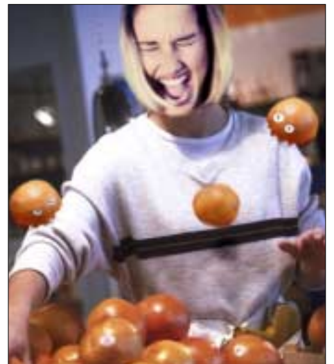
Lågprisvaror i alla länder skall en dag förena sig och resa sig mot sina förtryckare.

Det är bedrövligt att sån här form av diskriminering förekommer på tjugohundratalet, och behovet av en produktombudsman har väl aldrig kännas så angeläget som nu.