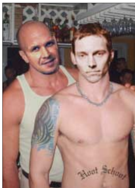
Ungdomsrevolt eller några depraverade kreatörers unartade efterfest? Historierna går isär...

Det sanningsälskande nyhetsorganet RtC beslöt sig givetvis för att gräva vidare i denna svavelstinkande härva och, även om vi anade oegentligheter, blev vi minst sagt bestörta av det vi fann.