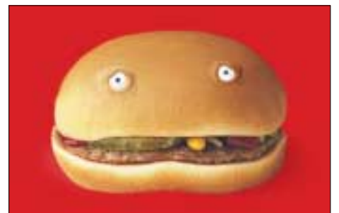
– Jag känner mig så billig och har börjat hata "sexköparna", säger Hamburgare 6 kronor.